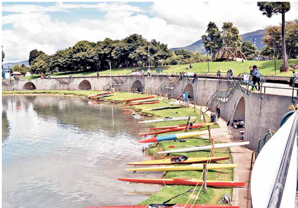
Embarcadero de botes, Liga de Canotaje de Bogotá

En el 2020 el deporte al igual que todos los procesos se han transformado a causa de la Pandemia de la COVID-19, por ello desde el mes de marzo los atletas vienen realizando su práctica de manera virtual hasta que se disponga volver a retoma los entrenamientos en el parque Simón Bolívar.