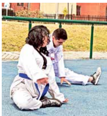
Escuela de Taekwon-Do ITF ARANA.

Escuela de patinaje Beaver Bless, el profesor Edison Gonzá-