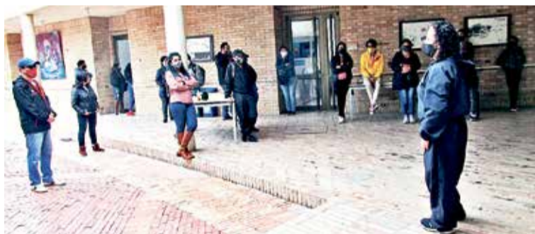
Taller con comunidad estrategia ETIS realizado en el CDC Porvenir Bosa.

El ejercicio continuará en las siguientes semanas con las labores de caracterización de las familias y el inicio de las primeras acciones de respuesta por parte de la Secretaria de Integración Social.