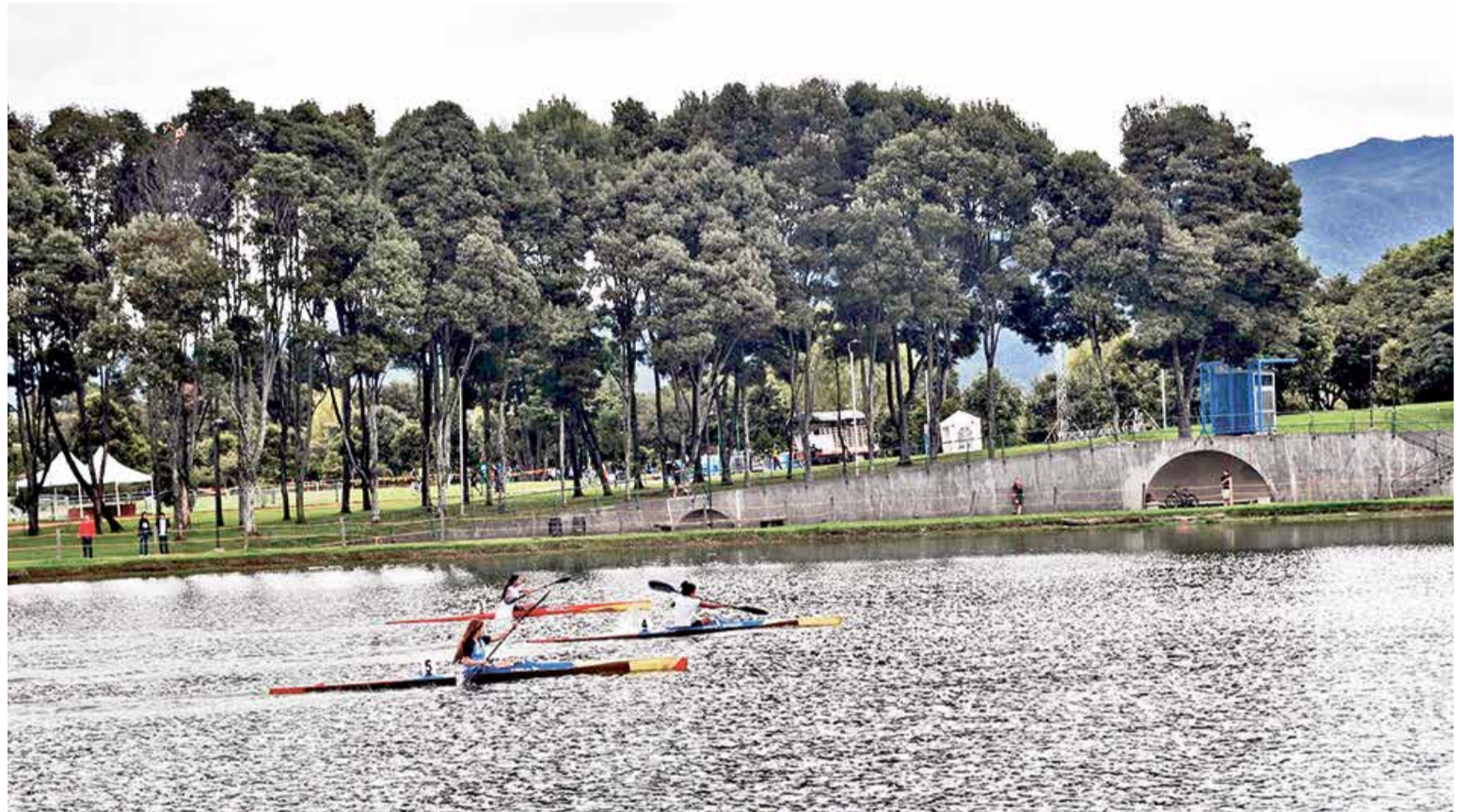
VII Regata Parque Metropolitano Simón Bolívar.