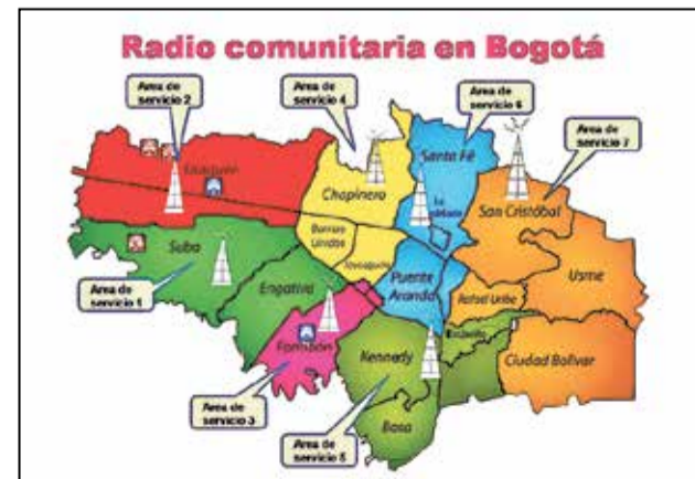
Mapa de Bogotá, la demarcada en color verde oscuro es la correspondiente al área de servicio número 5.