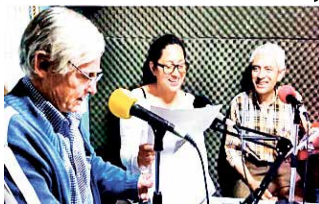
Cabina de radio Vientos Estéreo 94.4 del F.M.

Cuando una radio promueve la participación de los ciudadanos y defiende sus intereses; cuando responde a los gustos de la mayoría y hace del buen humor y la esperanza su primera propuesta; cuando informa verazmente; cuando ayuda a resolver los mil y un problemas de la vida cotidiana; cuando en sus programas se debaten todas las ideas y se respetan todas las opiniones; cuando se estimula la diversidad cultural y no la homogenización mercantil; cuando la mujer protagoniza la comunicación y no es una simple voz decorativa o un reclamo publicitario; cuando no se tolera ninguna dictadura, ni siquiera la musical impuesta por las disqueras; cuando la palabra de todos vuela sin discriminaciones ni censuras, ésa es una radio comunitaria”. José Ignacio López Vigil. Manual urgente, Radialistas apasionados@s. 1997.