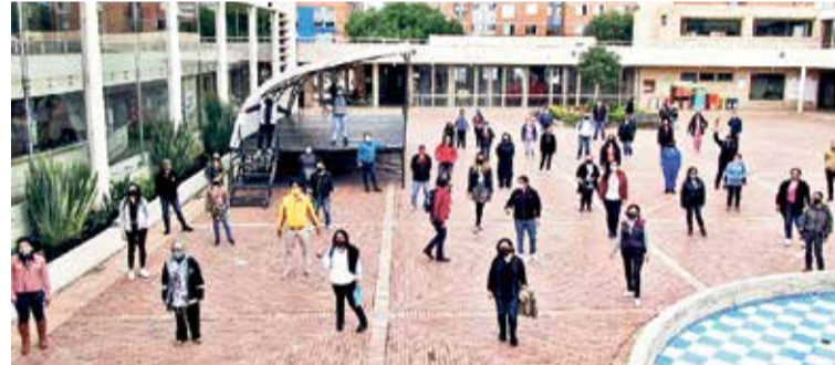
Taller con comunidad estrategia ETIS realizado en el CDC Porvenir Bosa.