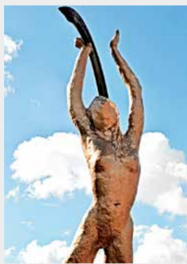
Imagen del monumento Princesa Usminia.

Iván nos cuenta la historia de esa mujer desnuda, lo primero a saber es que ella, es nada menos ni nada más que la representación de una de las mujeres más hermosas de la historia Muisca, la Princesa Usminia hija del Cacique Saguamachica; este monumento fue construido en 1997 por una convocatoria a nivel nacional de generación de empleo para mano de obra no