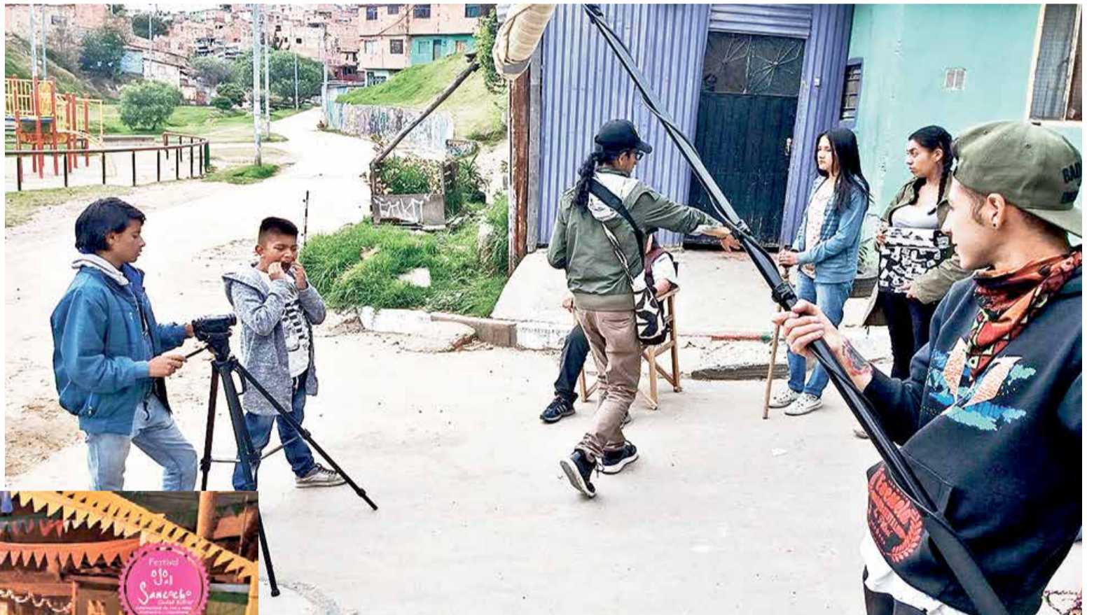
Grabación en Ciudad Bolívar Ojo al Sancocho.

con los realizadores y protagonistas será lo que los habitantes de la localidad 19 podrán disfrutar Ojo al Sancocho se realizará del 03 al 10 de octubre de 2020.